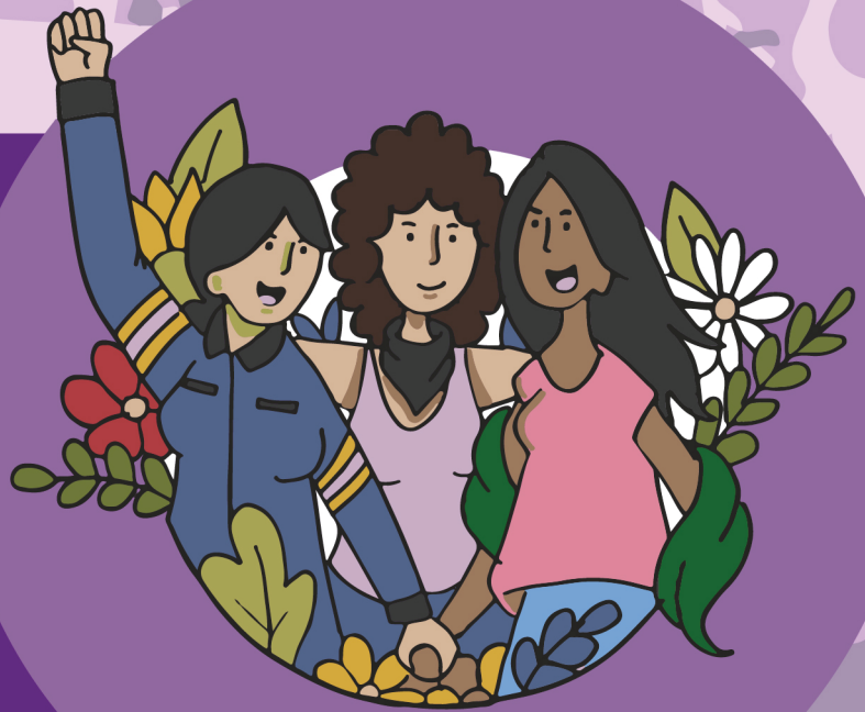
Ilustración: Ma. Fernanda Justo Hernández

Geografías feministas desde América Latina